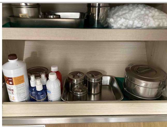
산부인과 기본기구 및 소모품