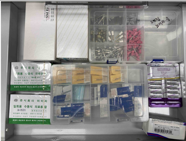
치과 기본기구 및 소모품