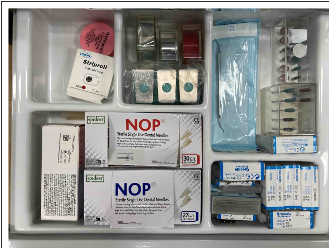
치과 기본기구 및 소모품