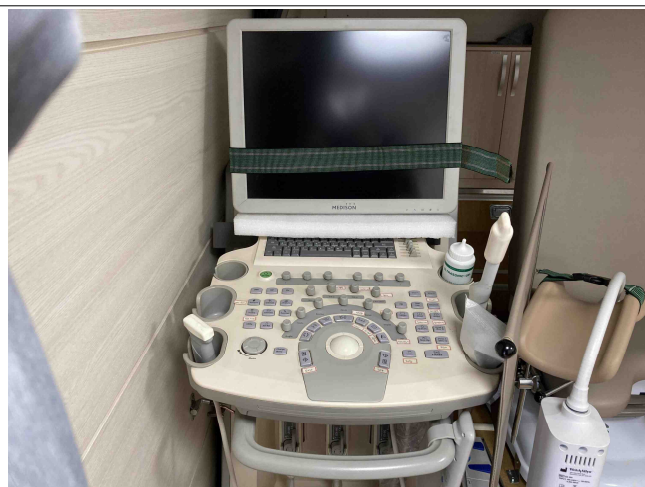
산부인과 초음파 진단기