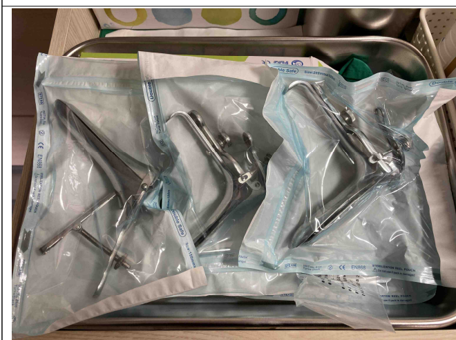
산부인과 기본기구(진찰질경, 석션튜브 등)