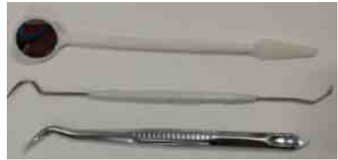
미러, 핀셋, 익스플로러